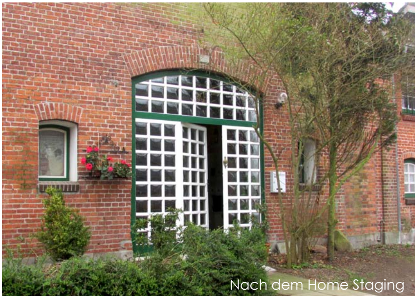
Nach dem Home Staging

Durch das Zurückschneiden des Fassadenbewuchses werden besondere Details der Immobilie sichtbar.